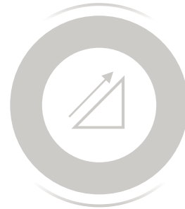
Phase 2 Ramp up