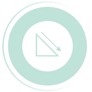
Phase 1 Ramp down