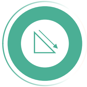
Phase 1 Ramp down

Die 1. Phase, der Ramp down, ist davon geprägt, schnell Informationsasymmetrien zu beseitigen und gezielt Maßnahmen zu ergreifen.