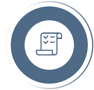
Phase 3 Retrospektive